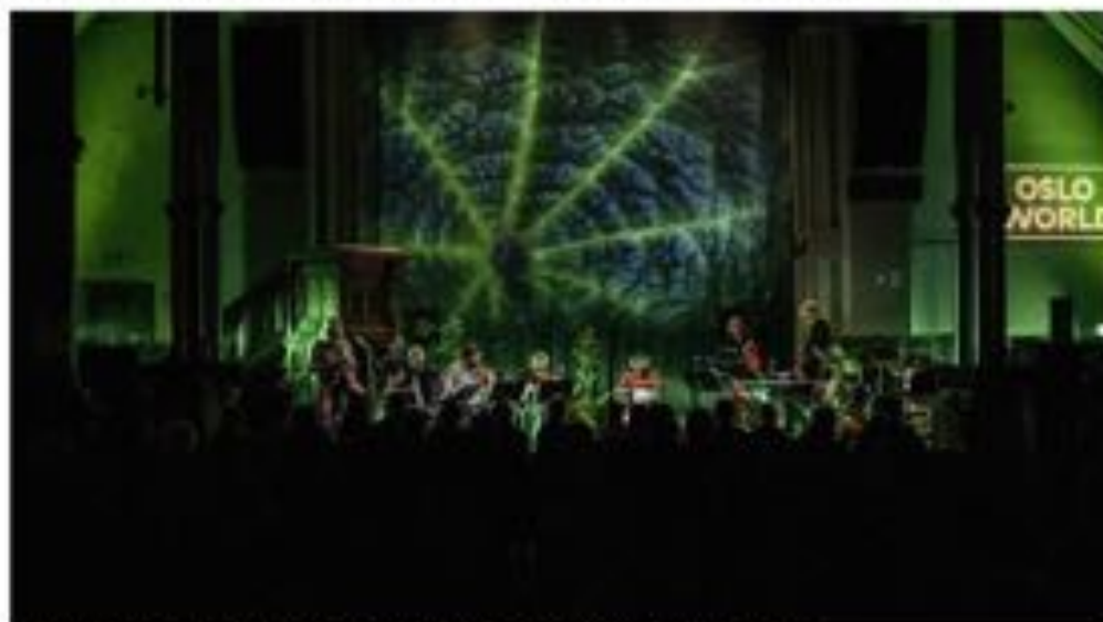
Tingingsverket som vart framført på musikkfestivalen Oslo World i oktober 2020, er no komen ut som album.

Musikk Rosaima er eit vakkert og tankevekkjande oppgjær med vekstfilosofien i kapitalismen.