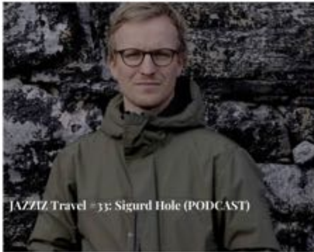
JAZZIZ Travel #33: Sigurd Hole (PODCAST)